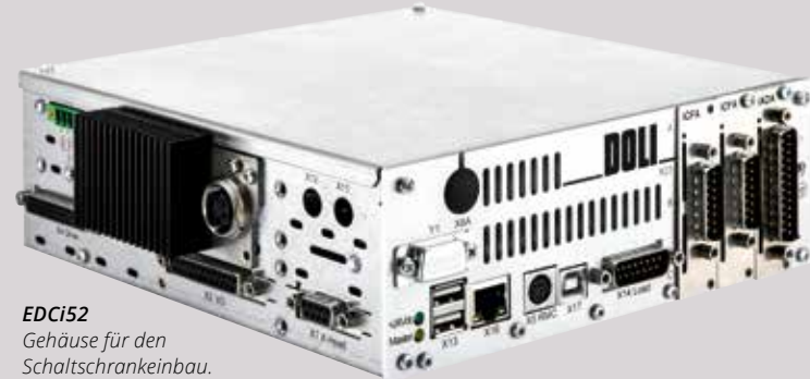
EDCi52 Gehäuse für den Schrankschrankbau.