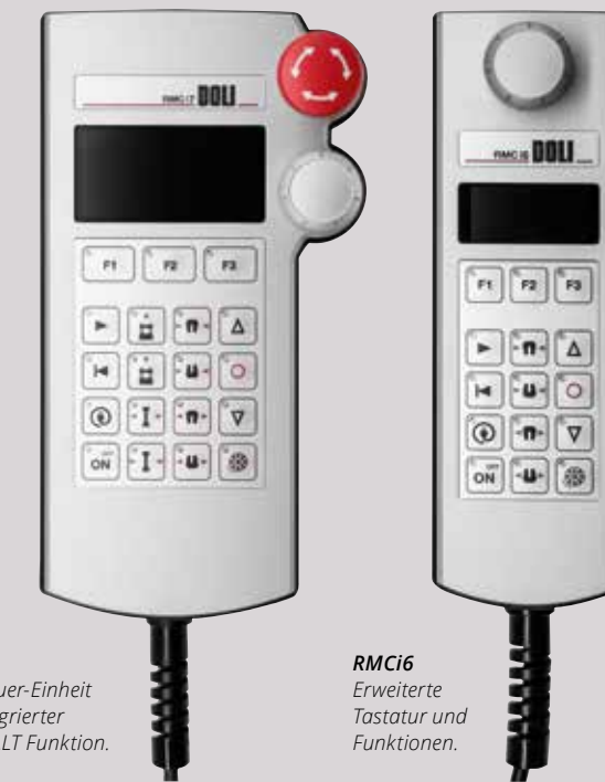
RMCi7 Fernsteuer-Einheit mit integrierter NOT-HALT Funktion.

Das EDCi hat den Kraft- und Weg-Kanal in der Grundausstattung integriert.